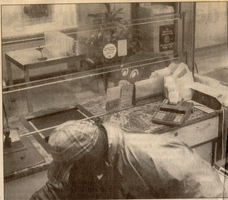
Einer der beiden Bodenheimer Bankräuber trug bei der Tat eine schottenmusterartig karierte Basketballmütze.