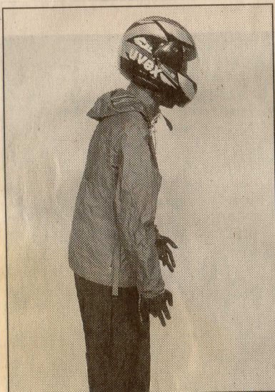
Wer kennt Kleidung und/oder Motorradhelm des Nackenheimer Bankräubers?

Hinweise in beiden Fällen an die Polizei in Mainz, Telefon 0 61 31/ 65 45 01 oder die Staatsanwaltschaft, Telefon 0 61 31/14 18 17.